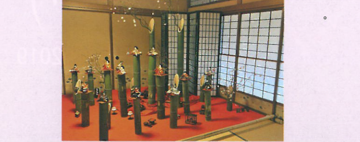
◆下にならんでいる写真はこれまでの各会場の様子で、今年の展示内容と異なります

4 旧齋藤家別邸 「旧齋藤家別邸でひなまつり」 新潟市中央区西大畑町576番地 025-210-8350 開館期間2月19日(火)～3月17日(日) 開館時間/9:30～17:00 駐車場 無し 入館料/一般300円・小中学生100円 江戸時代に廻船問屋「間瀬屋」を営んでいた鈴木家に伝わる昭和初期の雛人形や大江山大洲の地主渡邊家に伝わる江戸時代の享保雛を展示します。建築100年を迎えた旧齋藤家別邸で華やかなひなまつりをお楽しみください