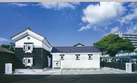
●こちらに並んでいる写真はこれまでの各会場の様子で今年の展示内容とは異なります

新潟市中央区明石2丁目3-44 025-250-5280 展示期間2月4日～3月21日 開館時間2月28日まで10:00～17:00(平日) 10:00～18:00(土・日・祝) 3月1日より11:00～18:00(平日) 10:00～18:00(土・日・祝) 休館日無し 入館料 無料 駐車場 有り